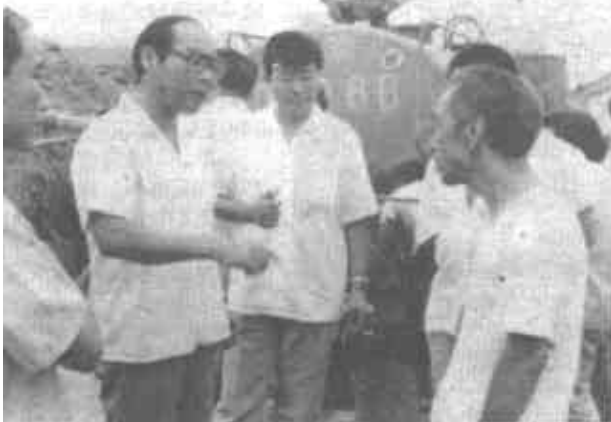
持续干旱，利津县许多乡村农民饮水告急。县党政领导亲自调集车辆为缺水乡村送水。图为县委领导为严重缺水的付窝乡农民送水的情景。

现在，经过他实验成功的乳化沥青不但经济而且使用方便，不用任何高温处理，比原热沥青提高工效两倍多，受到施工单位的青睐。