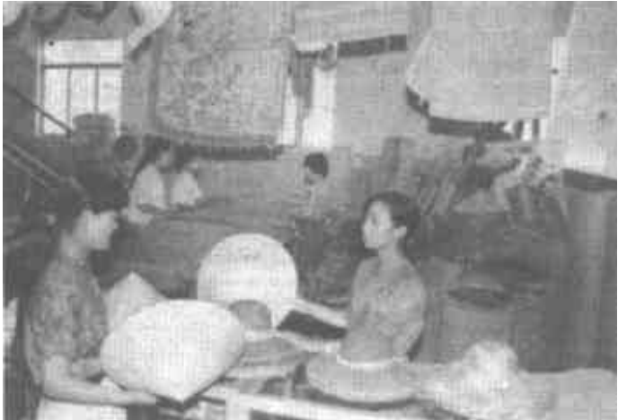
为方便消费者选购夏令商品，市人民商场在二楼新设夏令用品专柜，深受消费者欢迎。图为专柜一角。

东营区农行开办电脑兑付国债新业务，兑付效率提高3倍多。自7月1日以来，该行兑付国债696笔，金额16.1万元，无一差错。(郭洪峰 杨盛林)